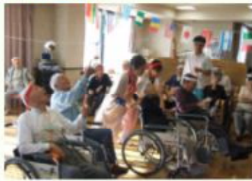
秋の運動会 「あんぱん競争」