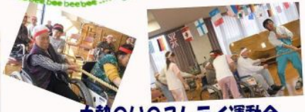
白熱のいのこしデイ運動会