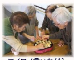
ワイワイ言いながら、たこやきを焼きました。

発行 名古屋市東区 旗手町第1-1501 老人会館2階 いのこしデイホーム 052(777)6600(代) 052(777)6606(直) 毎月末日発行