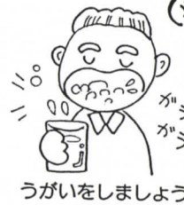
うがいをしましょう